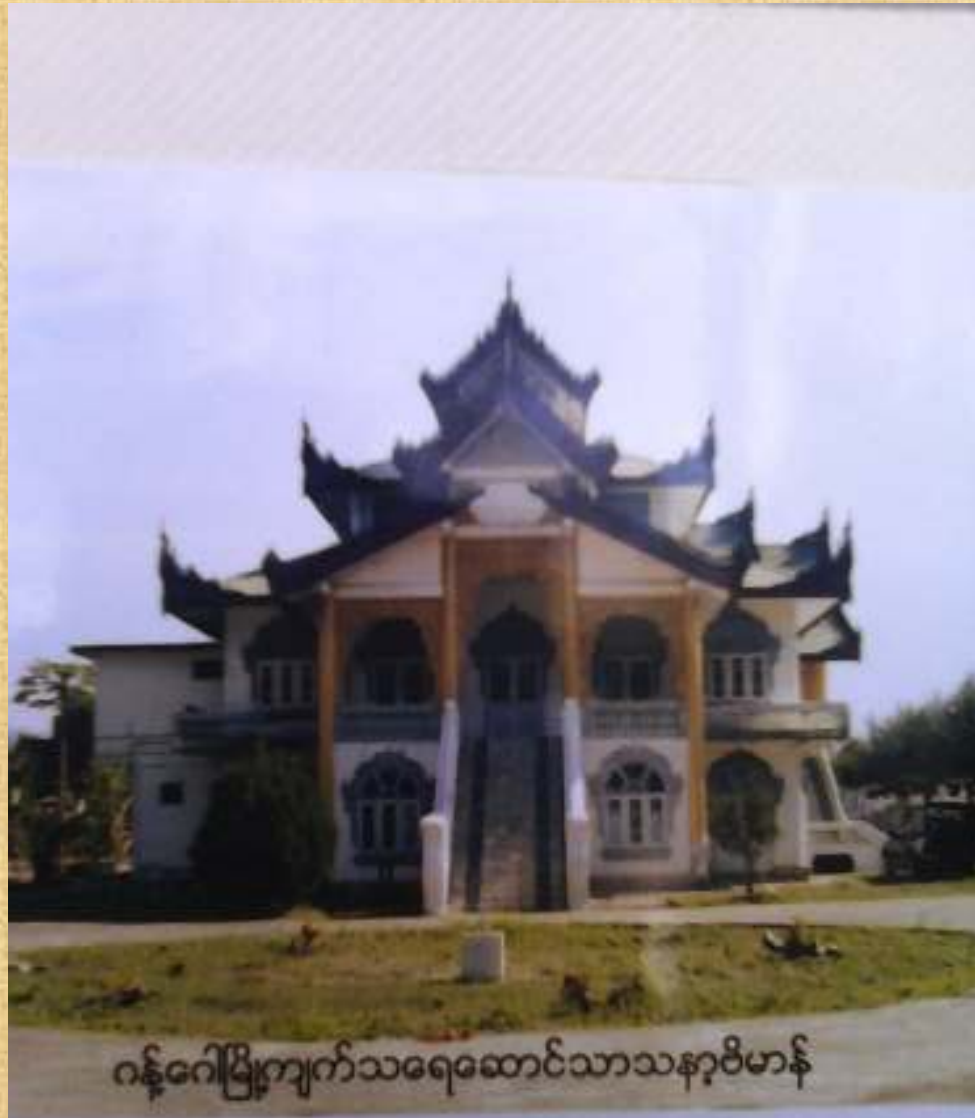
ဂန့်ဂေါပြိုကျက်သရေဆောင်သာသနာ့ဗိမာန်