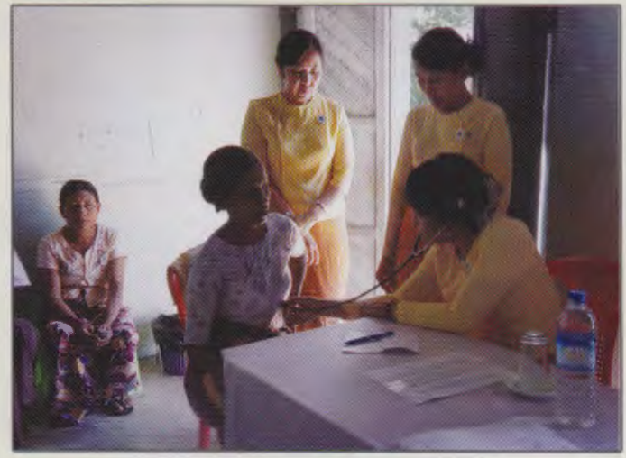
ကျန်းမာရေးဝန်ကြီးဌာန ပြည်ထောင်စုဝန်ကြီး ဒေါက်တာဖေသက်ခင်မှ ကျန်းမာရေးစောင့်ရှောက်မှုပေးနေစဉ်