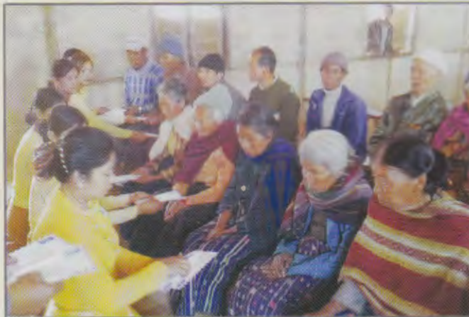
ချင်းပြည်နယ် မိခင်နှင့်ကလေးစောင့်ရှောက်မှု ကြီးကြပ်ရေးအဖွဲ့ ဥက္ကဋ္ဌနှင့်အဖွဲ့ဝင်များမှ သက်ကြီးရွယ်အိုအဘိုးအဘွားများအား ပူဇော်ကန်တော့နေစဉ်

ချင်းပြည်နယ် မိခင်နှင့် ကလေးစောင့် ရှောက်မှု ကြီးကြပ်ရေးအဖွဲ့ ဥက္ကဋ္ဌနှင့်အဖွဲ့ဝင်များ၊ ဟားခါးမြို့နယ် မိခင်နှင့်ကလေးစောင့်ရှောက်ရေးအသင်းဝင်များ စုပေါင်း၍ (၁-၁၁-၂၀၁၃)ရက်နေ့တွင် အပြည်ပြည်ဆိုင်ရာ သက်ကြီးရွယ်အိုများနေ့ အထိမ်းအမှတ်အဖြစ် ဟားခါးမြို့ ပေသလ ဘိုးဘွားရိပ်သာတွင်နေထိုင်သော အဘိုးအဘွားများအား တစ်ကိုယ်ရေ သန့်ရှင်းရေးပြုလုပ်ပေးခြင်း၊ အားပေးစကားပြောခြင်း၊ ငွေသားဖြင့် ပူဇော်ကန်တော့ခြင်းများ ပြုလုပ်ခဲ့ကြပါသည်။