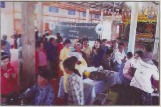
ကျောက်မဲမြို့နယ်၊ ပိန္နဲကုန်းကျေးရွာ၌ ကျန်းမာရေးအသိပညာပေးဟောပြောပြီး လိုအပ်သည့်ဆေးဝါးများကုသပေးနေစဉ်