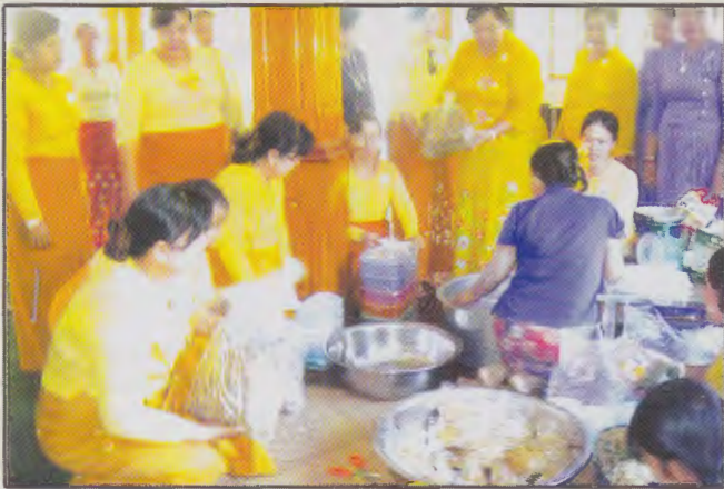
ဧရာဝတီတိုင်းဒေသကြီးမိခင်နှင့်ကလေးစောင့်ရှောက်မှု ကြီးကြပ်ရေးအဖွဲ့ဥက္ကဋ္ဌနှင့် အဖွဲ့ဝင်များသည် မိသားစုဝင်ငွေတိုးစေရန်အတွက် ငါးခြောက်လုပ်ငန်းအား သွားရောက်ကြည့်ရှုနေစဉ်

(၆-၁၂-၂၀၁၃)ရက်နေ့တွင် ဧရာဝတီတိုင်းဒေသကြီး မိခင်နှင့်ကလေးစောင့်ရှောက်မှုကြီးကြပ်ရေးအဖွဲ့မှ ကျိုက်လတ်မြို့နယ်၌ မိသားစုဝင်ငွေတိုး ငါးခြောက်လုပ်ငန်းသို့သွားရောက်ကြည့်ရှုအားပေးပြီး သင်တန်းဖွင့်လှစ်ရန်နှင့် အသင်းဝင်များအား အလုပ်အကိုင်ရှာဖွေပေးခြင်းတို့ကို လမ်းညွှန်ဆောင်ရွက်ပေးခဲ့ပါသည်။