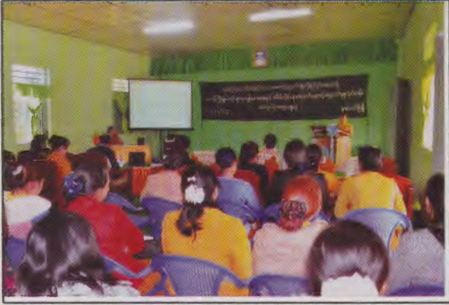
ရှမ်းပြည်နယ် မိခင်နှင့်ကလေးစောင့်ရှောက်မှု ကြံ့ကြပ်ရေးအဖွဲ့ ရုံးခန်းမ၌ပြုလုပ်သည့် သက်ကြီးရွယ်အိုများ ကျန်းမာရေးနှင့် အိမ်တိုင်ရာရောက် စောင့်ရှောက်လုပ်ငန်း အလုပ်ရုံဆွေးနွေးပွဲ ပြုလုပ်ဆောင်ရွက်စဉ်

ရှမ်းပြည်နယ် မိခင်နှင့်ကလေးစောင့်ရှောက်မှု ကြံ့ကြပ်ရေး အဖွဲ့သည် ပြည်နယ်ကျန်းမာရေးဦးစီးဌာနနှင့်ပူးပေါင်း၍ သက်ကြီးဘိုးဘွားများအား အိမ်တိုင်ရာရောက် ကျန်းမာရေး စောင့်ရှောက်မှုလုပ်ငန်း အလုပ်ရုံဆွေးနွေးပွဲကို (၂၂-၁၁-၂၀၁၃) ရက်နေ့တွင် တောင်ကြီးမြို့၊ ပြည်နယ်မိခင်နှင့်ကလေးစောင့် ရှောက်မှုကြံ့ကြပ်ရေးအဖွဲ့ရုံးတွင် ပြုလုပ်ဆောင်ရွက်ခဲ့ပါသည်။