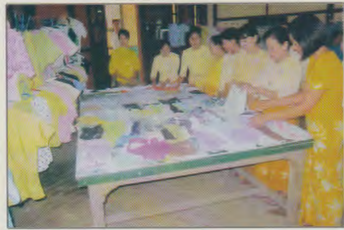
မန္တလေးတိုင်းဒေသကြီးမိခင်နှင့်ကလေးစောင့်ရှောက်မှု ကြီးကြပ်ရေးအဖွဲ့နာယကနှင့်အဖွဲ့ဝင်များ သင်တန်းသူများချုပ်ထားသည့်အဝတ်အထည်များ ကြည့်ရှုအားပေးနေစဉ်

မန္တလေးတိုင်းဒေသကြီး၊ မိတ္ထီလာခရိုင်၊ မလှိုင်မြို့နယ် တွင် ၂၀၁၃ ခုနှစ်အတွင်း အခြေခံစက်ချုပ်သင်တန်းနှင့် အဆင့်မြင့်စက်ချုပ်သင်တန်း(၅)ကြိမ် စဉ်ဆက်မပြတ်ဖွင့်လှစ်ခဲ့ရာ အခြေခံစက်ချုပ်သင်တန်းသို့ သင်တန်းသူ (၁၃၅)ဦး၊ အဆင့်မြင့်သင်တန်း၌ (၆၉)ဦး တက်ရောက်သင်ကြားခဲ့ပါသည်။ အခြေခံစက်ချုပ်သင်တန်းတွင် ဖန်စီအိတ်၊ စီးကွင်း ထိုးနည်းများ ကိုပါ သင်ကြားပေးခဲ့ပြီး အဆင့်မြင့်သင်တန်းတွင် မိန်းမဝတ် ပုံဆန်း၊ ယောက်ျားဝတ် ရှပ်အင်္ကျီ အတွင်းဝတ်အင်္ကျီတို့ သင်ကြားပေးခဲ့ပါသည်။ သင်တန်းသူ (၅)ဦးအား အပ်ချုပ်စက် (၁)လုံးစီ အရစ်ကျရောင်းချပေးခဲ့ပြီး သင်ထောက်ကူပစ္စည်း များကို ထောက်ပံ့ပေးခဲ့ပါသည်။