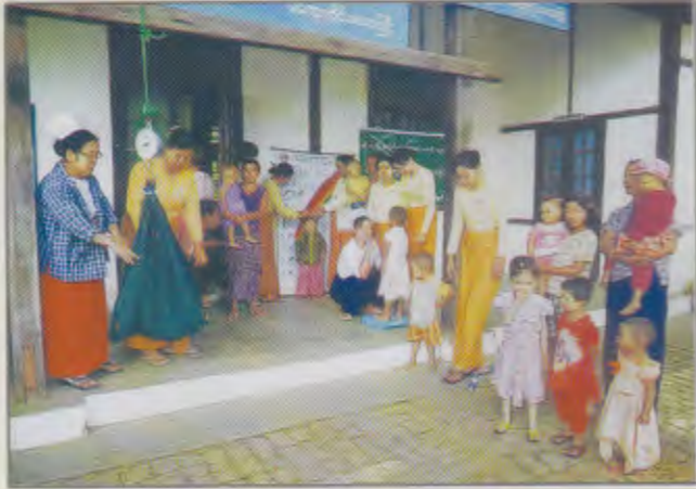
မင်းလှမြို့နယ်မိခင်နှင့်ကလေးစောင့်ရှောက်ရေးအသင်းမှ ကလေးငယ်များအား ကိုယ်အလေးချိန်ပေးနေစဉ်

မကွေးတိုင်းဒေသကြီး၊ သရက်ခရိုင်၊ မင်းလှမြို့နယ် မိခင်နှင့်ကလေးစောင့်ရှောက်ရေးအသင်းမှ မိခင်ကလေး ကျန်းမာရေးဌာနတွင် (၅) နှစ်အောက်ကလေးများအား ကိုယ်အလေးချိန်ပေးခြင်း၊ အရပ်တိုင်းပေးခြင်း၊ ကျန်းမာရေး စောင့်ရှောက်မှုများပြုလုပ်ပေးပြီး အမှတ်(၅)ရပ်ကွက်မှ အာဟာရချို့တဲ့ကလေးများကို နွားနို့ဆန်ပြုတ်နှင့် အာဟာရများ တိုက်ကျွေးခဲ့ကြပါသည်။