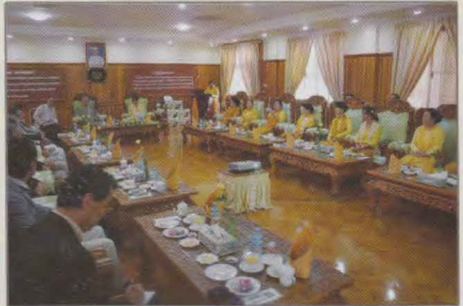
မြန်မာနိုင်ငံမိခင်နှင့်ကလေးစောင့်ရှောက်ရေးအသင်းသို့ အိန္ဒိယကြည်းတပ်ဦးစီးချုပ်၏ဇနီးလာရောက်ပြီး အပ်ချုပ်စက်များလှူဒါန်းစဉ်