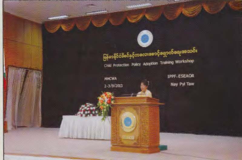
မြန်မာနိုင်ငံမိခင်နှင့်ကလေးစောင့်ရှောက်ရေးအသင်းနှင့် IPPF - ESEAOR တို့ပူးပေါင်းကျင်းပသော “Child Protection Policy Adoption Training Workshop” တွင် လူမှုဝန်ထမ်း၊ ကယ်ဆယ်ရေးနှင့် ပြန်လည်နေရာချထားရေးဝန်ကြီးဌာနပြည်ထောင်စုဝန်ကြီး ဒေါက်တာမြတ်မြတ်အုန်းခင်မှ အဖွင့်အမှာစကားပြောကြားနေစဉ်