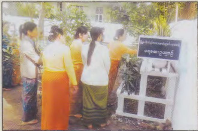
နေပြည်တော်မိခင်နှင့်ကလေးစောင့်ရှောက်မှု ကြီးကြပ်ရေးအဖွဲ့ နာယကနှင့်ဥက္ကဋ္ဌတို့မှ လယ်ဝေးမြို့နယ်ရှိ ပရဆေးဥယျာဉ်အား လှည့်လည်ကြည့်ရှုနေစဉ်

နေပြည်တော်မိခင်နှင့်ကလေးစောင့်ရှောက်မှု ကြီးကြပ်ရေးအဖွဲ့ နာယက၊ ဥက္ကဋ္ဌနှင့်အဖွဲ့ဝင်များသည် (၂၅-၁၁-၂၀၁၃) ရက်နေ့တွင် လယ်ဝေးမြို့နယ် မိခင်နှင့်ကလေးစောင့်ရှောက်ရေးအသင်းရုံး၌ စိုက်ပျိုးထားသည့် တိုင်းရင်းဆေးစိုက်ခင်းအား ကြည့်ရှုလေ့လာပြီး လိုအပ်သည်များကို လမ်းညွှန်မှာကြားခဲ့ပါသည်။