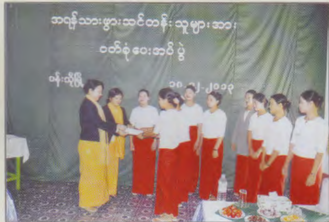
စစ်ကိုင်းတိုင်းဒေသကြီး မိခင်နှင့်ကလေးစောင့်ရှောက်မှုကြီးကြပ်ရေးအဖွဲ့နာယကမှ ဝန်းသိုမြို့နယ် အရန်သားဖွားဆောင်တန်းသူများအား သင်တန်းစရိတ်များ ထောက်ပံ့ပေးနေစဉ်

စစ်ကိုင်းတိုင်းဒေသကြီး မိခင်နှင့်ကလေးစောင့်ရှောက်မှု ကြီးကြပ်ရေးအဖွဲ့ နာယကနှင့်အဖွဲ့ဝင်များသည်(၁၈-၁၂-၂၀၁၃)ရက်နေ့တွင် ဝန်းသိုမြို့နယ်ပြည်သူ့ဆေးရုံ၌ ဖွင့်လှစ်ထားသည့် အရန်သားဖွားဆရာမသင်တန်းသို့ ရောက်ရှိပြီး သင်တန်းသူ(၁၁)ဦးအတွက် ဝတ်စုံနှင့်ထောက်ပံ့ငွေ (၁၀၀၀၀) ကျပ်ကိုလည်းကောင်း သင်တန်းတွင် သင်ကြားပေးနေသည့် မြို့နယ်ပြည်သူ့ဆေးရုံမှ ဆရာမ(၇)ဦးအတွက် ထောက်ပံ့ငွေ (၇၀၀၀)ကျပ်ကို လည်းကောင်း အသီးသီးထောက်ပံ့ ပေးအပ်ခဲ့ပါသည်။ ၎င်းနောက် စစ်ကိုင်းတိုင်းဒေသကြီး မိခင်နှင့်ကလေးစောင့်ရှောက်မှုကြီးကြပ်ရေးအဖွဲ့ နာယကနှင့်အဖွဲ့ဝင်များသည် ဝန်းသိုမြို့နယ် မိခင်နှင့်ကလေးမှုကြိုကျောင်းသို့ သွားရောက်ပြီး မူကြိုကလေးငယ်များအား နို့ဆန်ပြုတ်တိုက်ကျွေးခြင်း၊ သင်ထောက်ကူ ပစ္စည်းများနှင့်အလှူငွေ (၃၀၀၀၀)ကျပ်တို့ကို ထောက်ပံ့လှူဒါန်းခြင်းတို့ကို ဆောင်ရွက်ခဲ့ပါသည်။