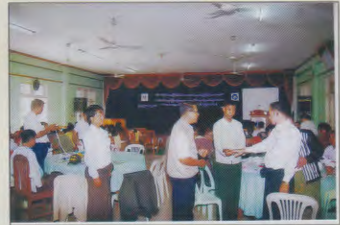
မန္တလေးတိုင်းဒေသကြီး မိခင်နှင့်ကလေးစောင့်ရှောက်မှုကြီးကြပ်ရေးအဖွဲ့နှင့် ကယ်ဆယ်ရေးနှင့်ပြန်လည်နေရာချထားရေး ဦးစီးဌာနတို့ပူပေါင်းဖွင့်လှစ်သောသဘာဝ ဘေးအန္တရာယ်ကြိုတင်ကာကွယ်ရေးစီမံခန့်ခွဲမှု သင်တန်းလက်တွေ့သရုပ်ပြနေစဉ်

မန္တလေးတိုင်းဒေသကြီးမိခင်နှင့်ကလေးစောင့်ရှောက်မှု ကြီးကြပ်ရေးအဖွဲ့နှင့် ကယ်ဆယ်ရေးနှင့်ပြန်လည်နေရာ ချထားရေးဦးစီးဌာနတို့ ပူပေါင်းဖွင့်လှစ်သော သဘာဝဘေး အန္တရာယ် ကြိုတင်ကာကွယ်ရေးစီမံခန့် ခွဲမှုသင်တန်းကို ၂၀၁၃ ခုနှစ် ဒီဇင်ဘာလ(၂၆)ရက်နေ့တွင်ကျင်းပပြုလုပ်ခဲ့ပါသည်။