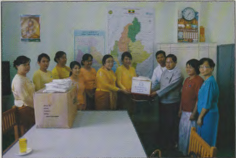
မြန်မာနိုင်ငံမိခင်နှင့်ကလေးစောင့်ရှောက်ရေးအသင်းဥက္ကဋ္ဌ၊ ဒုတိယဥက္ကဋ္ဌနှင့်ဗဟိုအလုပ်အမှုဆောင်အဖွဲ့ဝင်များမှ နေပြည်တော်ကောင်စီနယ်မြေရှိ ဆေးရုံများသို့ တစ်ခါသုံးမွေးအိတ်များလှူဒါန်းစဉ်

မြန်မာနိုင်ငံမိခင်နှင့်ကလေးစောင့်ရှောက်ရေးအသင်းမှဥက္ကဋ္ဌ၊ ဒုတိယဥက္ကဋ္ဌနှင့်ဗဟိုအလုပ်အမှုဆောင်အဖွဲ့ဝင်များ နေပြည်တော်ကောင်စီနယ်မြေရှိဆေးရုံများသို့ တစ်ခါသုံးမွေးအိတ်များထောက်ပံ့လှူဒါန်း