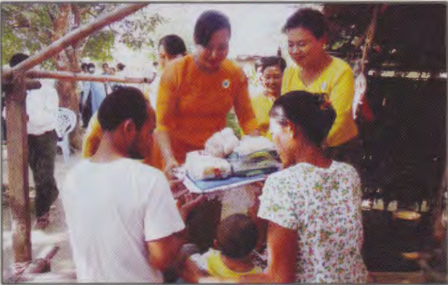
ရခိုင်ပြည်နယ်မိခင်နှင့်ကလေးစောင့်ရှောက်မှုကြံ့ကြပ်ရေးအဖွဲ့ နာယက၊ ဥက္ကဋ္ဌနှင့်အဖွဲ့ဝင်များမှ AIDS ဝေဒနာရှင်များအားအိမ်တိုင်ယာရောက်ထောက်ပံ့ပစ္စည်းများပေးနေစဉ်

ရခိုင်ပြည်နယ် မိခင်နှင့်ကလေးစောင့်ရှောက်မှုကြံ့ကြပ်ရေးအဖွဲ့ နာယက၊ဥက္ကဋ္ဌနှင့်အဖွဲ့ဝင်များမှ စစ်တွေမြို့ မင်းဂံရပ်ကွက်ရှိ HIV / AIDS ရောဂါဝေဒနာရှင်များအား အိမ်တိုင်ယာရောက် ကျန်းမာရေးစောင့်ရှောက်မှုများ ပြုလုပ်ပြီး ငွေနှင့်အာဟာရများ သွားရောက်ထောက်ပံ့ခဲ့ပါသည်။