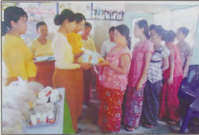
တနင်္သာရီတိုင်းဒေသကြီးမိခင်နှင့်ကလေးစောင့်ရှောက်မှုကြံ့ကြပ်ရေးအဖွဲ့ဥက္ကဋ္ဌနှင့်အဖွဲ့ဝင်များကိုယ်ဝန်ဆောင်များအားအာဟာရများနှင့်အားဆေးများထောက်ပံ့နေစဉ်

တနင်္သာရီတိုင်းဒေသကြီး မိခင်နှင့်ကလေးစောင့်ရှောက်မှုကြံ့ကြပ်ရေးအဖွဲ့ ဥက္ကဋ္ဌနှင့်အဖွဲ့ဝင်များသည် (၄-၁၁-၂၀၁၃)ရက်နေ့တွင် ပုလောမြို့နယ်၊ မီးလောင်ချောင်းသားဖွားခန်းတွင် လာရောက်ပြသသော ကိုယ်ဝန်ဆောင်များအတွက် အာဟာရနှင့်အားဆေးများထောက်ပံ့ ပေးခဲ့ပါသည်။