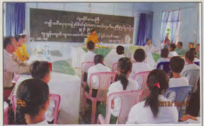
ပဲခူးတိုင်းဒေသကြီးမိခင်နှင့်ကလေးစောင့်ရှောက်မှုကြံ့ကြပ်ရေးအဖွဲ့ နာယကမှNFPEထူးချွန်ကျောင်းသားများအားထောက်ပံ့ချီးမြှင့်ခြင်းအခမ်းအနားတွင် အဖွင့်အမှာစကားပြေကြားနေစဉ်

(၁၅-၁၀-၂၀၁၃)ရက်နေ့တွင် ပဲခူးတိုင်းဒေသကြီး မိခင်နှင့်ကလေးစောင့်ရှောက်မှုကြံ့ကြပ်ရေးအဖွဲ့ နာယက၊ ဥက္ကဋ္ဌနှင့်အဖွဲ့ဝင်များသည် ပဲခူးမြို့၊ အမှတ်(၆) အခြေခံပညာအထက်တန်းကျောင်းသို့ သွားရောက်၍ ကျောင်းပြင်ပမူလတန်းပညာရေးထူးချွန်ကျောင်းသားများအားထောက်ပံ့ချီးမြှင့်ခြင်းအခမ်းအနားတွင် ထူးချွန်ကျောင်းသူ(၁)ဦးအား ထောက်ပံ့ငွေ(၅)သောင်းကျပ် ပေးအပ်ချီးမြှင့်ခဲ့ပြီး ဆက်လက်ပညာ သင်ကြားနိုင်ရေးအတွက် တိုင်းဒေသကြီးမိခင်နှင့်ကလေးစောင့်ရှောက်မှုကြံ့ကြပ်ရေးအဖွဲ့မှ လစဉ်ထောက်ပံ့ငွေများ ပေးအပ်ခဲ့ပါသည်။ ထို့နောက် ပဲခူးမြို့မိခင်နှင့်ကလေးစောင့်ရှောက်ရေး အသင်းပိုင် သားဖွားခန်းသို့ သွားရောက်၍ ကိုယ်ဝန်ဆောင်မိခင်(၈)ဦးအား ကွေကာအုပ်၊ ကြက်ဥနှင့်အိုင်အိုင်ဒင်းဆားများထောက်ပံ့ခဲ့ပြီး မြန်မာနိုင်ငံမိခင်နှင့် ကလေးစောင့်ရှောက်ရေးအသင်း(ဗဟို)မှ ထောက်ပံ့ခဲ့သော ချွေစုပ်စက်အားအသင်းပိုင်သားဖွားခန်းသို့ ပေးအပ်ခဲ့ပါသည်။