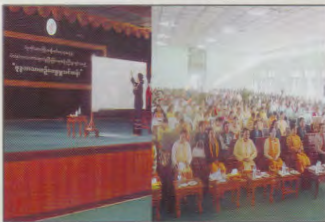
ပဲခူးတိုင်းဒေသကြီးမိခင်နှင့်ကလေးစောင့်ရှောက်မှုကြံ့ကြပ်ရေးအဖွဲ့ဝင်များမှ “ဗုဒ္ဓဘာသာယဉ်ကျေးမှုသင်တန်း” ဖွင့်လှစ်နေစဉ်

ပဲခူးတိုင်းဒေသကြီး မိခင်နှင့်ကလေးစောင့်ရှောက်မှုကြံ့ကြပ်ရေးအဖွဲ့သည် (၂၁-၁၂-၂၀၁၃)ရက်နေ့တွင် ပဲခူးမြို့