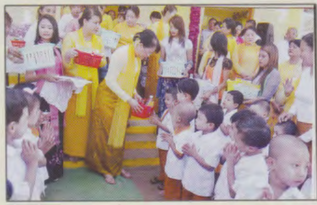
ရန်ကုန်တိုင်းဒေသကြီးမိခင်နှင့်ကလေးစောင့်ရှောက်မှု ကြီးကြပ်ရေးအဖွဲ့ နာယကမှမူကြို ကလေးငယ်များအား မုန့်များနှင့်လက်ဆောင်ပစ္စည်းများပေးအပ်နေစဉ်

ရန်ကုန်တိုင်းဒေသကြီး မိခင်နှင့်ကလေးစောင့်ရှောက်မှု ကြီးကြပ်ရေးအဖွဲ့ နာယက၊ ဥက္ကဋ္ဌနှင့်အဖွဲ့ဝင်များသည် ရန်ကုန်တိုင်းဒေသကြီး၊မြောက်ပိုင်းခရိုင်၊မှော်ဘီမြို့နယ် သို့(၁၈-၁၀-၂၀၁၃) ရက်နေ့တွင် ကွင်းဆင်းဆောင်ရွက်ခဲ့ပါသည်။ ထိုသို့ကွင်းဆင်းဆောင်ရွက်ရာတွင် မှော်ဘီမြို့နယ် မိခင်နှင့် ကလေးသားဖွားခန်းသို့ ကြည့်ရှုစစ်ဆေးခဲ့ပြီး ကိုယ်ဝန်ဆောင် မိခင် (၁၆)ဦးအား အာဟာရဖြည့်အစားစာများ ထောက်ပံ့ ပေးအပ်ခြင်း ၊မှော်ဘီမြို့နယ်အသင်းပိုင် မူကြိုကျောင်းသို့ သင်ထောက်ကူပစ္စည်းများပေးအပ်ခြင်းနှင့် မူကြိုကလေးငယ် (၃၂)ဦးတို့ကို အာဟာရဖြည့် အစားအစာများ ထောက်ပံ့ပေး အပ်ခဲ့ပါသည်။ ထို့နောက် နာယကနှင့်အဖွဲ့ဝင်များသည် မှော်ဘီမြို့နယ်ခန်းမတွင် ဆေးစိမ်ခြင်ထောင်ပေးအပ်ခြင်း၊ သရုပ်ပြခြင်းနှင့်ကျန်းမာရေး အသိပညာပေးဟောပြောပွဲ အခမ်းအနားကို ပြုလုပ်ကျင်းပခဲ့ပါသည်။ အခမ်းအနားတွင် နာယကမှ ခရိုင်များသို့ ဆေးစိမ်ခြင်ထောင် (၅၀၀) လုံး၊ ခြင်ထောင်ဆေးစိမ်ဆေးပြား (၁၀၀၀)ပြား ပေးအပ်ခဲ့ပါသည်။ ဆက်လက်ပြီး မှော်ဘီမြို့နယ်ဆရာဝန်ကြီးမှ သွေးလွန်း တုပ်ကွေးနှင့် ခြင်ကြောင့်ဖြစ်တတ်သော ရောဂါများအကြောင်း အသိပညာပေးဟောပြောခဲ့ပါသည်။