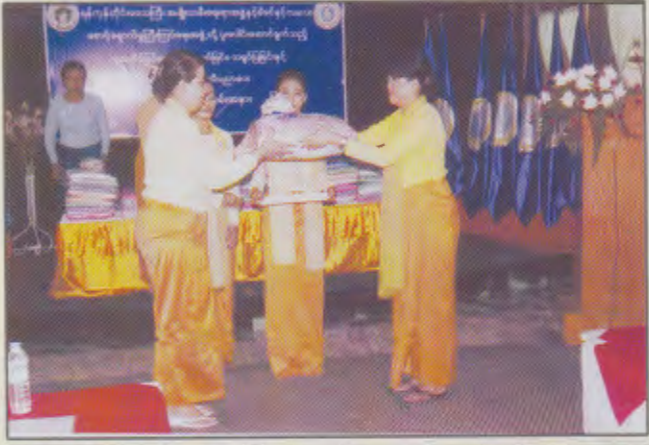
ရန်ကုန်တိုင်းဒေသကြီး၊မြောက်ပိုင်းခရိုင်၊ မှော်ဘီမြို့နယ် မြို့နယ်ခန်းမတွင် ရန်ကုန်တိုင်းဒေသကြီး မိခင်နှင့်ကလေး စောင့်ရှောက်မှုကြီးကြပ်ရေးအဖွဲ့ နာယကမှ ခရိုင်ဥက္ကဋ္ဌသို့ဆေးစိမ်ခြင်ထောင်များပေးအပ်စဉ်

ထို့နောက် သုတဝေလုံစာကြည့်တိုက်သွားရောက်ခဲ့ပြီး စာဖတ်ရုံနှင့်မြင့်တင်ရေး စာအုပ်စာစောင်များ ဖတ်ရှုနေသူများကို အားပေးကြည့်ရှုခဲ့ပြီး စာအုပ်၊စာစောင်များ ပေးအပ်လှူဒါန်း ခဲ့ပါသည်။