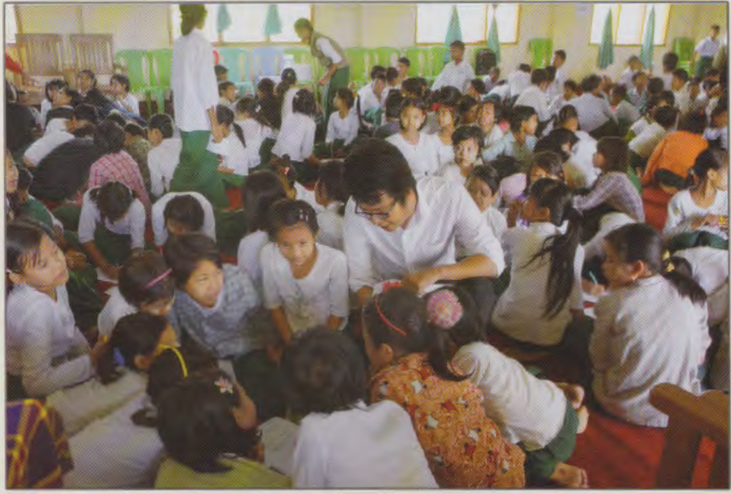
မြန်မာနိုင်ငံမိခင်နှင့်ကလေးစောင့်ရှောက်ရေးအသင်းမှ ပုဗ္ဗသီရိမြို့နယ် အ-ထ-က (၃)တွင် ပျိုရွယ်သူမျိုးဆက်ပွားကျန်းမာရေး အသိပညာ ဆွေးနွေးခြင်းများပြုလုပ်နေစဉ်

မြန်မာနိုင်ငံမိခင်နှင့်ကလေးစောင့်ရှောက်ရေးအသင်းမှနေပြည်တော်ကောင်စီအတွင်းရှိ အခြေခံပညာအထက်တန်းကျောင်းများတွင် ပျိုရွယ်သူမျိုးဆက်ပွားကျန်းမာရေး အသိပညာပေးခြင်းများပြုလုပ်